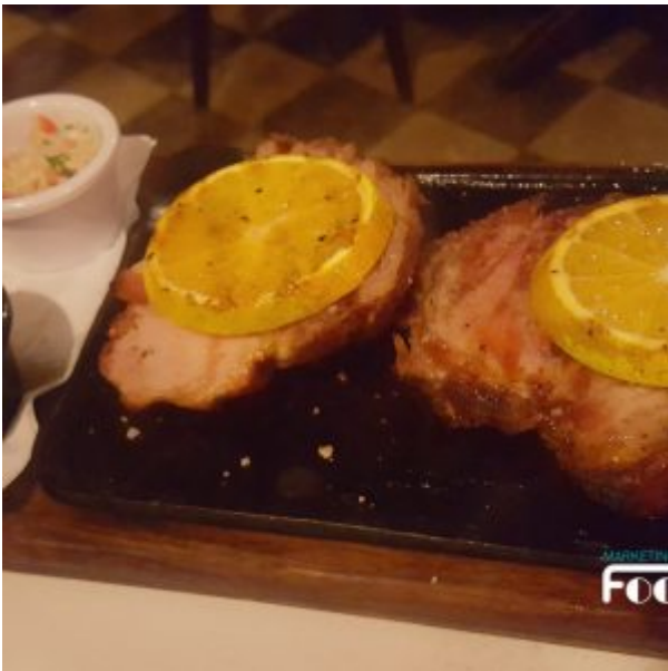
Bondiola a la naranja en La Cabrera Perú Sede Barranco