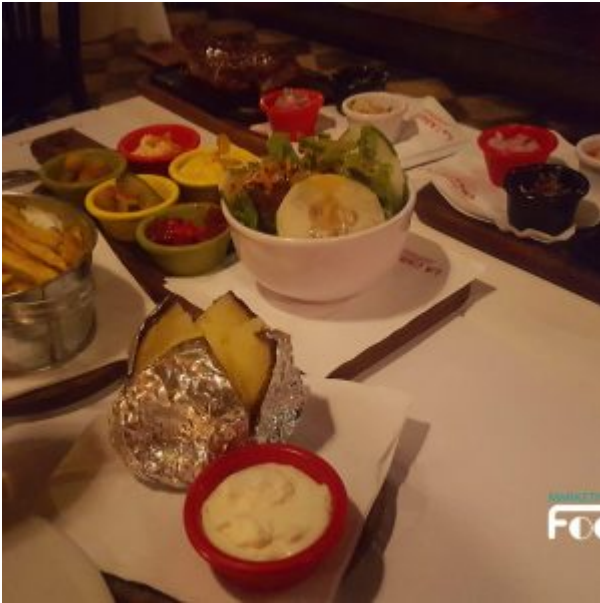
Guarniciones y Aperitivos en La Cabrera Perú Sede Barranco