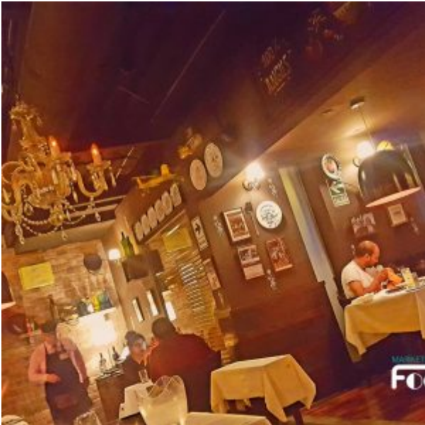
La Cabrera Perú Sede Barranco (Focdalain)