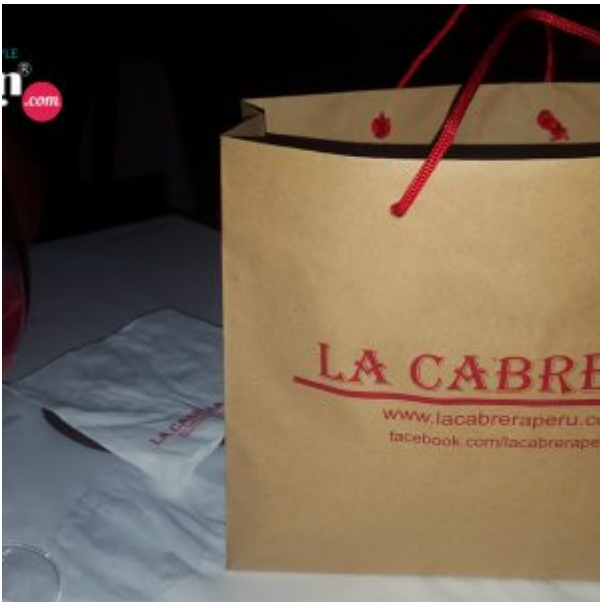
La Cabrera Perú Sede Barranco (Focdalain)