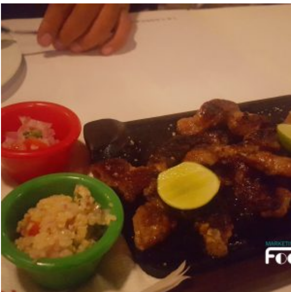
Chunchulines a la parrilla en La Cabrera Perú Sede Barranco