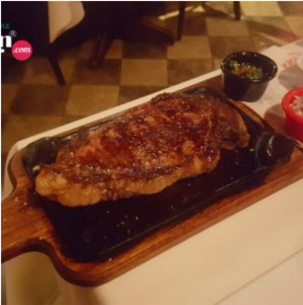
Carne Angus a la parrilla en La Cabrera Perú Sede Barranco